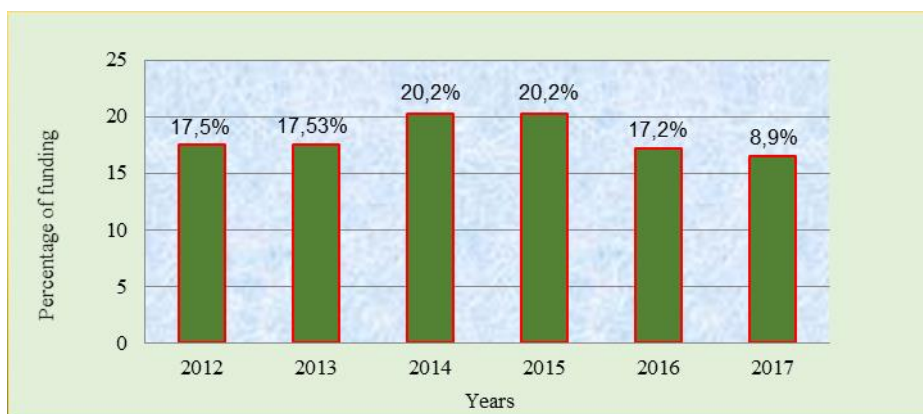
图 3.2 教育部门预算分配：2012-2017 年